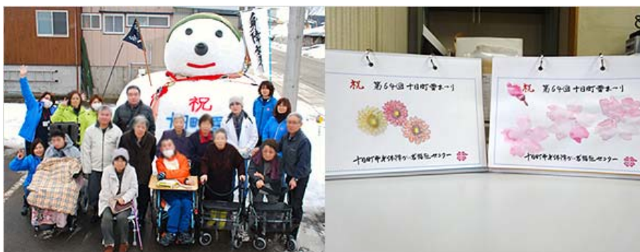
写真右：卓上カレンダー