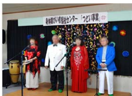
皆さんとてもお元気で、 私たちもパワーをもらいました。