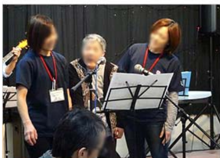
懐メロ歌声ひろば