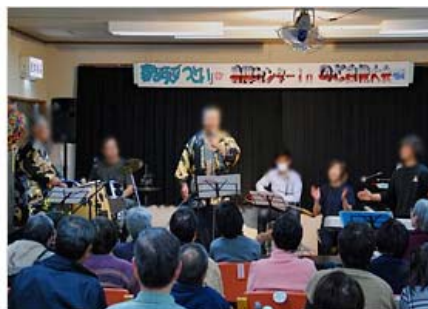
センターinのど自慢

話題の「レット・イット・ゴー ありのままに」も披露され、素晴らしい歌声と演奏を聴き、癒しのひとときとなりました。