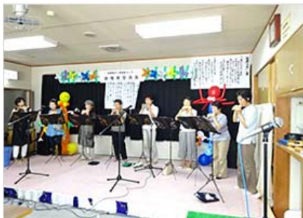
演芸ボランティア