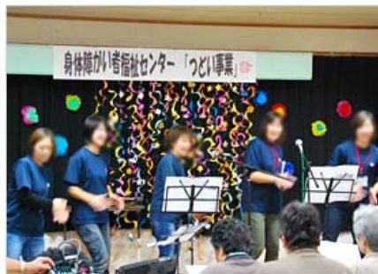
ご利用者もいっしょに「手紙」を歌い 大成功に終わりました。