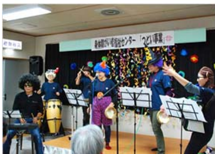
職員による演奏…おかしな変装に皆さん 大歓声！！とても喜んでいただきました。