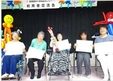
カラオケ大会 表彰式

平成26年8月22日(金)に地域活動支援センター及び障がい者センター利用者交流会を行いました。利用日の違う人たちが久しぶりに顔を合わせ、とても良い笑顔が見られました。