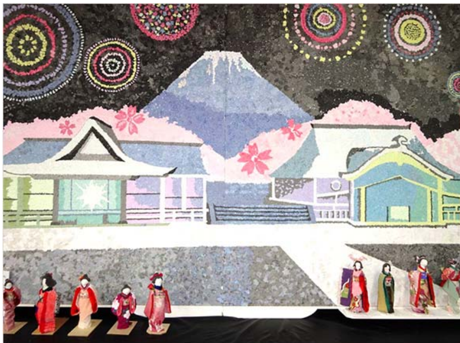
写真: 共同制作 貼り絵