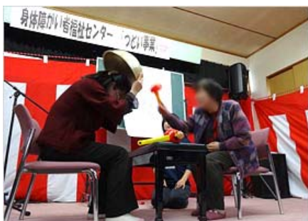
じゃんけん・たたいて・かぶってゲーム

身体障がい者福祉センターでは、ご利用者間の交流を目的として、活発に人とふれあい、心身ともに元気になっていただきたく、冬季交流会を開催いたしました。ゲームありマジックショーありで大盛況でした！