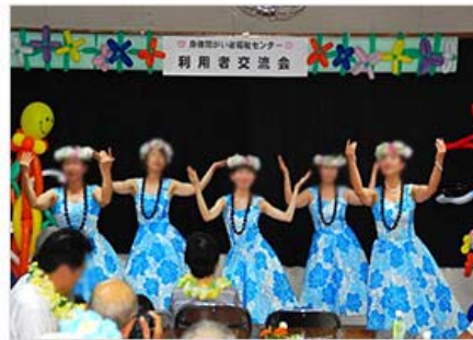
演芸ボランティア