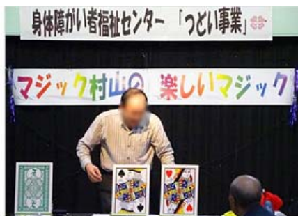
演芸ボランティア

「本気でたたかんねえてえ…」なんて言いながらも、なかなかのバトルが見られました。