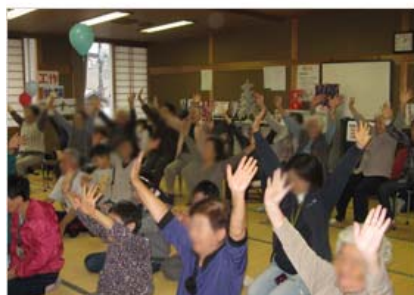
笑いヨガで“イエ～イ”