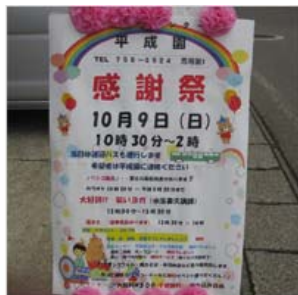
雨空の下の立て看板

第2回「感謝祭」を全館使用し盛大に開催しました。昨年の第1回目よりもさらにパワーアップし、お弁当等の販売やさまざまな無料イベントにプレゼント、笑いヨガ、大抽選会と限られた時間のなか大勢の皆さんから来園いただき、賑やかな笑い声に包まれました。