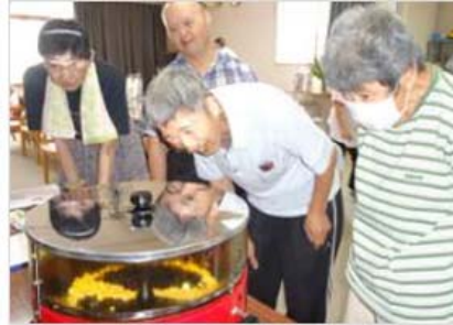
ポップコーン作り…おもしろ〜い！