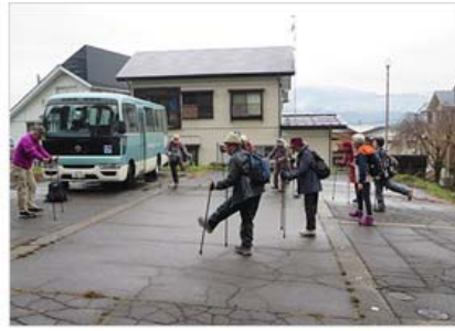
出発前の準備体操