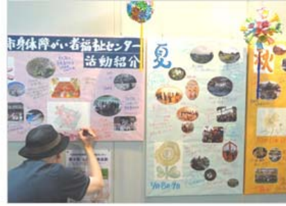
H27年度センター活動紹介パネル 写真をたくさん載せて、交流会や外出の 楽しい活動を紹介しました。