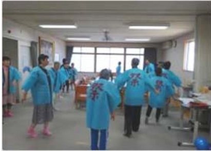
十日町小唄…皆さんさすが！お上手です。

ふれあいクラブで夏祭りを行い、十日町小唄を踊ったり、ペットボトルボーリングやアイス取りゲームをして楽しみました。お昼は手作りのお好み焼き！皆さん「おいし〜い！」と大喜び。たくさんの笑顔が見えました。