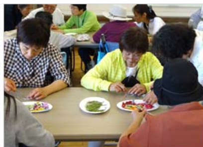
クラフト体験[押し花のキーホルダー]