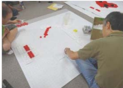
座って作業ができる利用者様が 頑張って貼って下さいました。

今年は、個人の受賞者はいらっしゃいませんでした。工芸部門では、ペットボトルキャップを使い、半年かけて大きな作品を制作しました。すばらしい作品が出来上がりましたが、惜しくも受賞を逃しました。