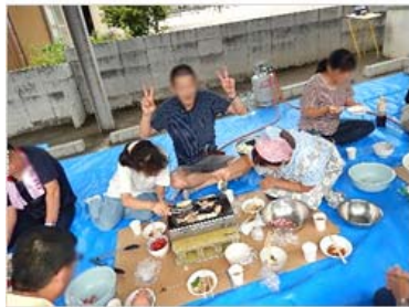
バーベキュー大会 支援センター駐車場