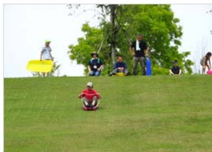
童心に帰リソリ滑り！ヤッホー！