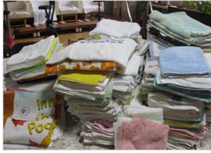
バスタオル・フェイスタオルをこんなにたくさん。