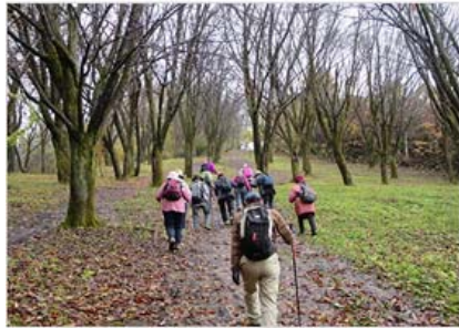
景色の良い緩やかな登り道