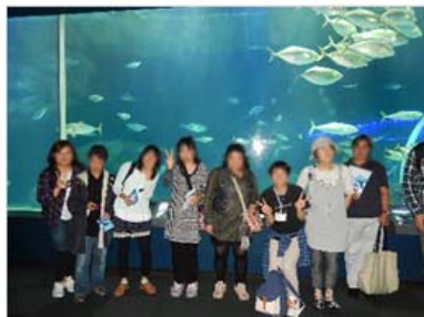
日帰り旅行 マリンピア日本海