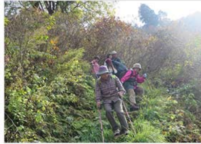
急な下りに注意して！！