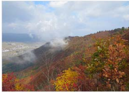
坂戸山山頂からの景色