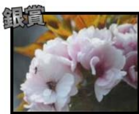
五十嵐勝一様 作品