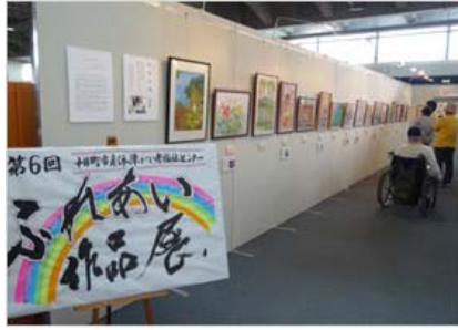
今年の作品は109点 過去最多! 利用者様の頑張りにより、 素晴らしい作品展となりました。