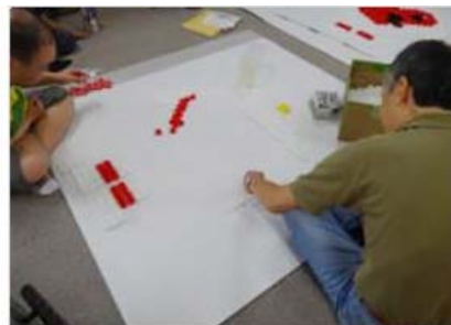
両面テープをはがし、台紙に貼ります。