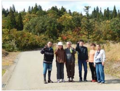
グループ活動 ナカゴグリーンパーク

1年間の活動でいろんな所に行って見学したり、美味しいものを食べるなど、楽しく活動に参加できました。