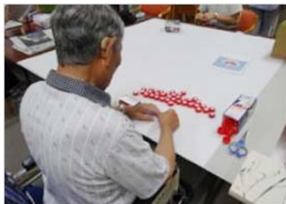
キャップの裏に両面テープを貼ります。

身障センターでは、新潟県障害者芸術文化祭に向け、共同作品として、今回はペットボトルキャップを使いモザイクアートに挑戦しています。大きな作品になるのでキャップを集めるのも一苦労です。どんなアート作品になるか楽しみです。