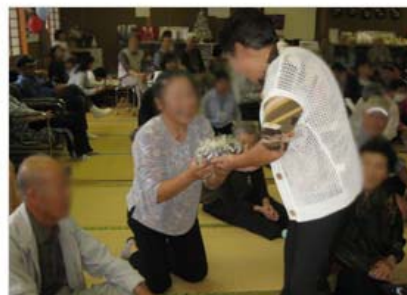
当たったわ～大抽選