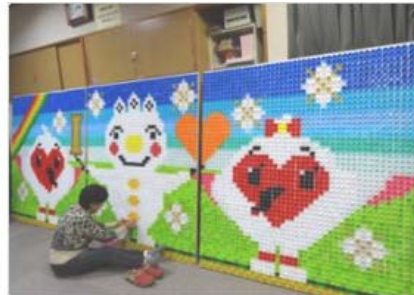
最後の仕上げ！ネージュくと、トッキッキの 出来上がり。きれいでしょ。