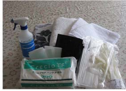
車載用感染症対策キット