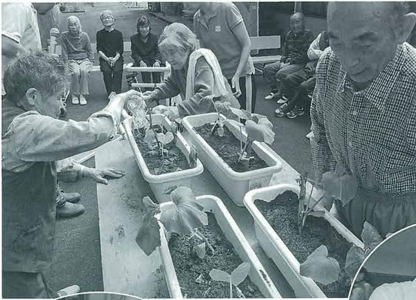
ベランダ菜園で きゅうりの苗を 植えました。