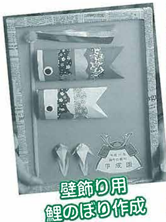
壁飾り用 鯉のぼり作成