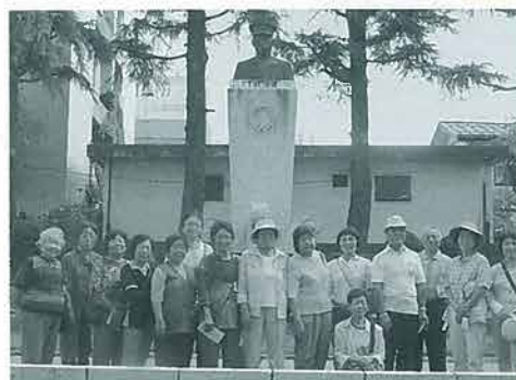
山本五十六銅像の前