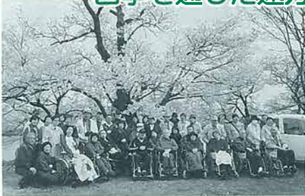
4月12日 上越高田方面 (利用者29名参加)