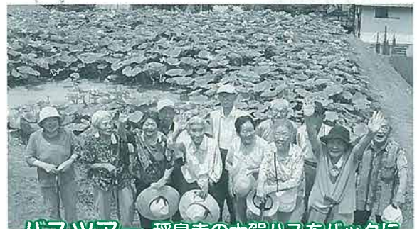
バスツアー 稲泉寺の大賀ハスをバックに