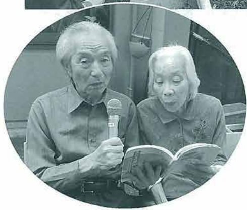
つまりの里で、 一番のおしどり 夫婦。 素敵にカラオケ を歌っていただ いています。