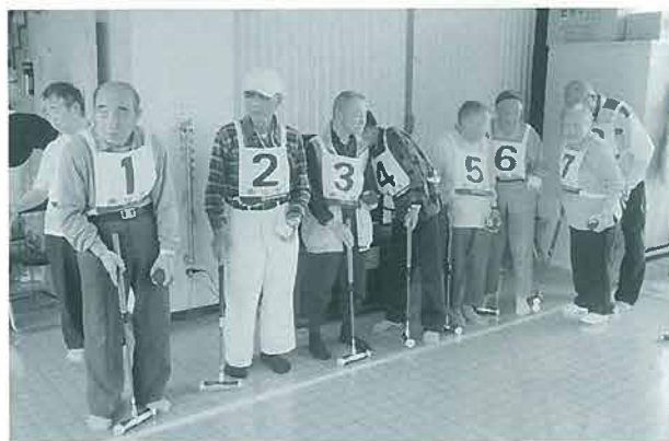
南山荘との交流会に向けて