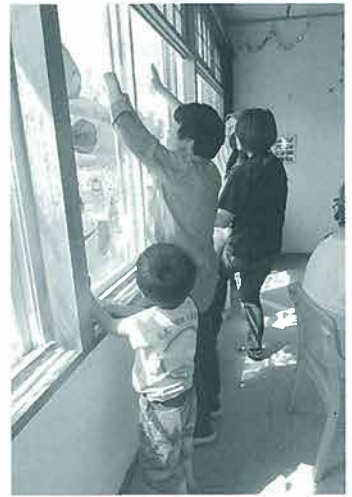
窓にペタペタ貼って…