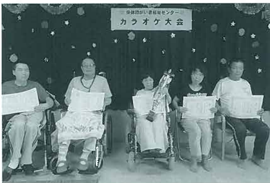
受賞された方達です