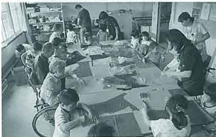
どんな魚が出来るかな？

6月24日(月)、当センター利用者さん、慈光保育園の年長組の皆さん、そして絵本と木の実の美術館スタッフさんで「泳ぐ巨大シズリンの髪飾り」を制作しました。カラーシートに絵を描いた物を切り取り、ガラスに貼り付ける作業です。利用者さんと園児達の笑い声が響く中、センターの窓はあっという間に海の生き物でいっぱいです。キラキラと光る日差しが差し込むたびに海の中にいるようでした。