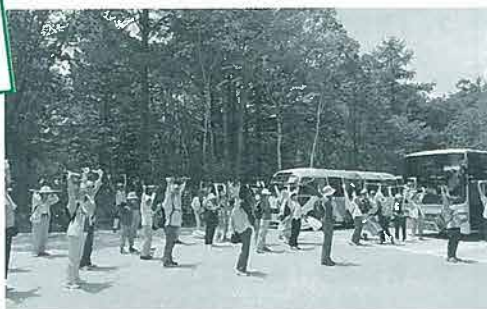
6月9日 健康のつどい 歩く前の準備体操です

「健康のつどい」は、戸隠神社で約4kmを歩き森林浴をしました。「納涼会」には尾身県議会議員が来賓として出席され、一緒に流しソーメンを味わいました。