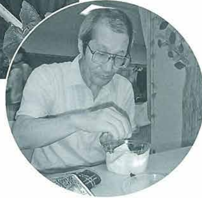
フロア内でもカ イワレ大根を栽 培しています。