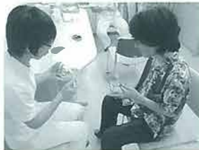
衛生士による指導の様子