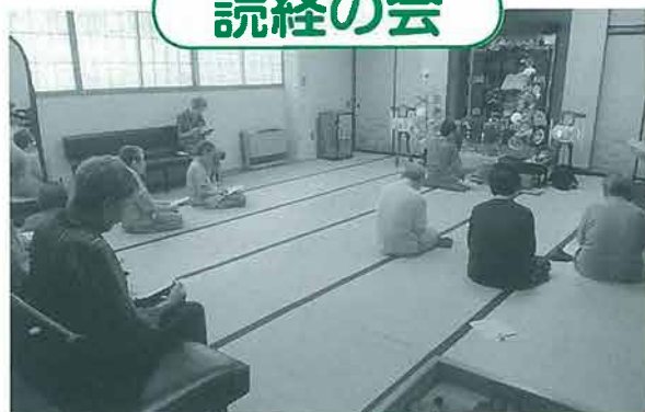
月2回と、春秋のお彼岸・お盆に仏間で