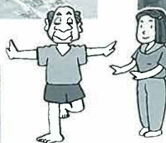
月2回先生を招いて