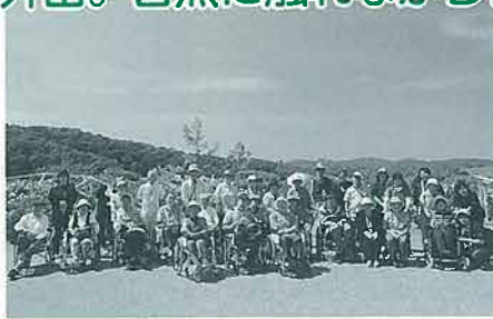
6月4日 長岡丘陵公園 (利用者23名参加)