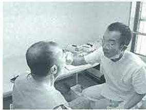
医師による健診の様子

このようなことから、今後も関係機関からの協力を得ながらこの「歯科保健」の事業を継続的に実施して行きたいと考えております。