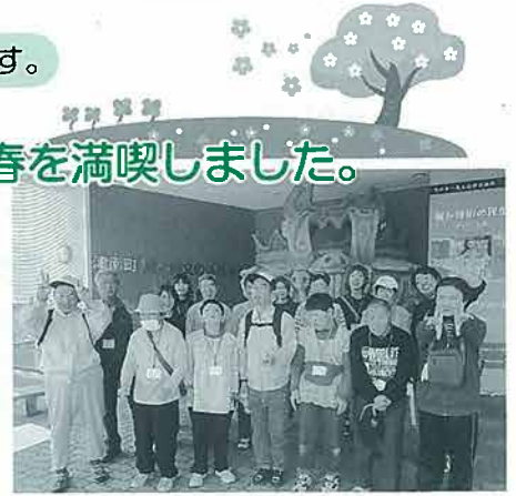
5月21日 ふれあいクラブ (津 南)