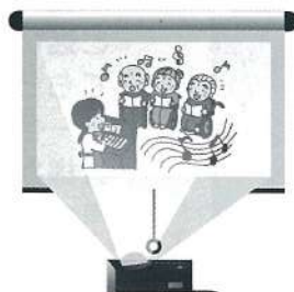
スライドショーで一年を振り返りました。