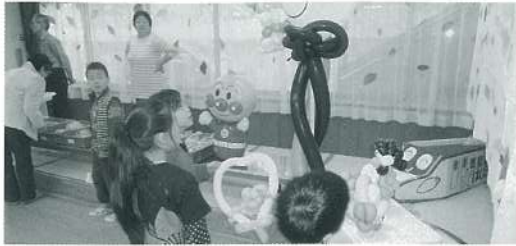
パザーやハーブティーのサービス、骨密度測定、風船のプレゼントも。

地域の皆様に支えられて60周年をむかえることができました。これからも、よろしくお願いいたします。