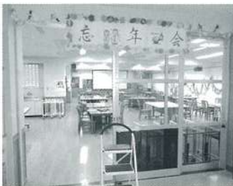
食堂を飾り付けアットホームな会場で行いました。

12月3日に忘年会を行いました。手作りの野菜を使った、よせ鍋・サーモンやイクラをふんだんに使った手作りの散らし寿司にアルコール…。一年間の行事ごとに撮った写真をスライドショーで振り返りました。入所者の皆様も食事の手を休め写真に見入っておられました。