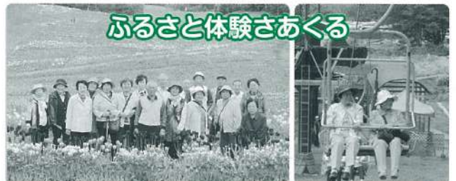
ふるさと体験さあくる

年間通して行っています。四季の様々な景色に囲まれ談笑しながら歩きます。自然の中でのおにぎりも美味しいです。