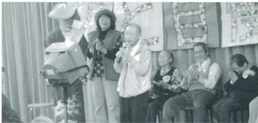
入所者の皆様の「のど自慢コンテスト」を開催!!