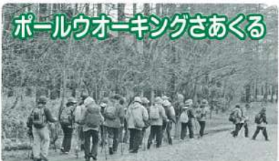
ポールウォーキングさあくる

12月11日(金)食育体験教室ベジキッチン様の協力で、平成園で米粉ピザの出前教室をしていただきました。米粉をこねることから始めて約2時間で焼き上がり。あつあつのピザを皆さんでおいしく試食しました。