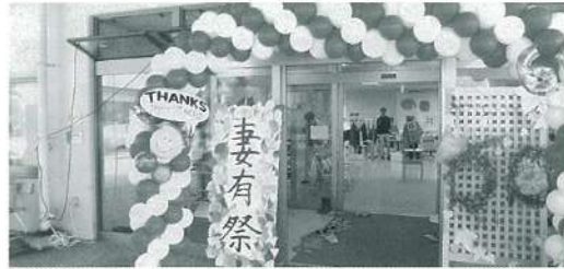
紅白の風船で彩られたアーチ「ありがとう60周年」の文字でお客様をお迎えしました。