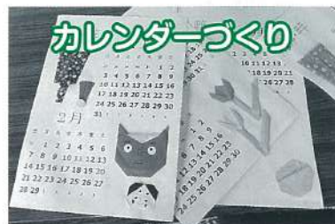
カレンダーづくり

3ヶ月に一度のお誕生日会です。皆さんでたこ焼きを作ってお祝いしました。手作りのたこ焼きおいしかったです。