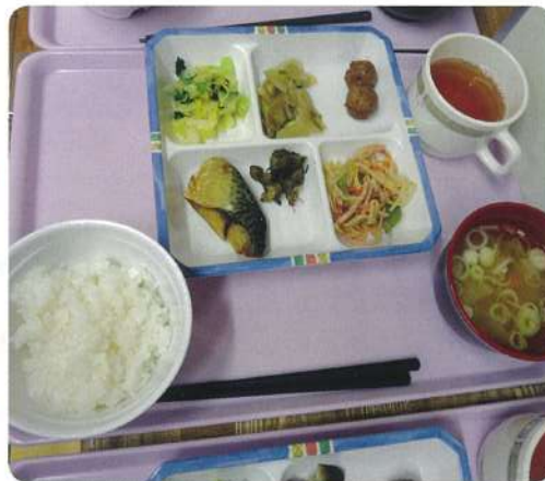
ある日の昼食メニューです。毎日ごちそうがありますよ!!