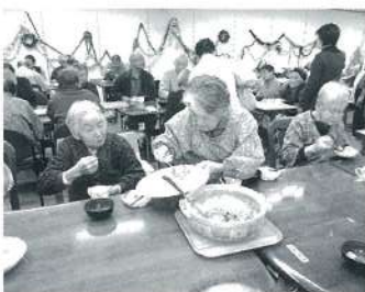
料理を取り分けたり、ビールをつぎあったりと和気あいあい話もはずみます。