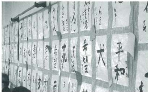
力作ぞろいでしょ?!