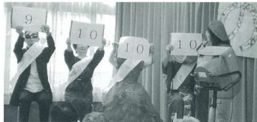
さて、気になる点数は?

12月3日に忘年会を行いました。手作りの野菜を使った、よせ鍋・サーモンやイクラをふんだんに使った手作りの散らし寿司にアルコール…。一年間の行事ごとに撮った写真をスライドショーで振り返りました。入所者の皆様も食事の手を休め写真に見入っておられました。