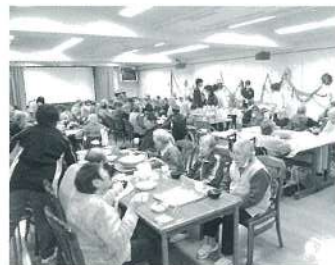
入所者様全員が揃っての会食は、とても珍しく楽しいものとなりました。