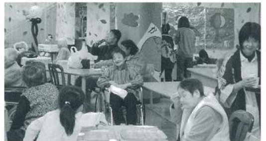
広いフロアーに屋台が並び、ジュース・カレー等選ぶのも楽しみの一つですね。

妻有祭が10月31日に行われ、妻有福祉会が今年創立60周年でもあることから「ありがとう60周年」という言葉と共に、地域の皆様に支えられて、この日を迎えられる事に感謝一杯の気持ちでお客様をお迎えいたしました。