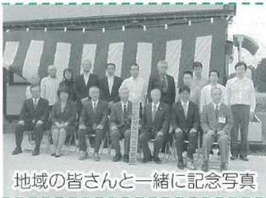
地域の皆さんと一緒に記念写真

平成28年10月に妻有福祉会で初の障がい者グループホーム“エンゼルハウス北新田”が、地域の皆様のご理解のもと、オープンいたしました。6名の方が自分らしいライフスタイルを目指し、地域のなかで生活を始めました。