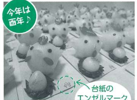
台紙のエンゼルマークが目印です。