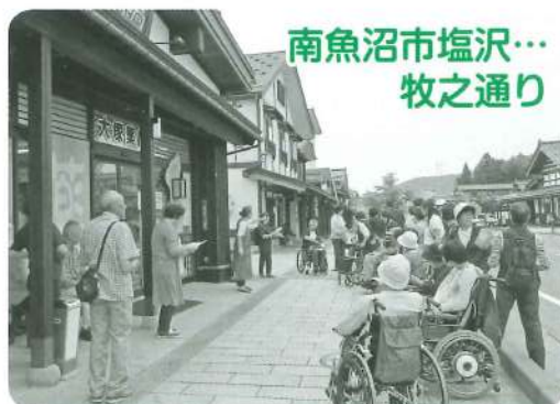
南魚沼市塩沢… 牧之通り