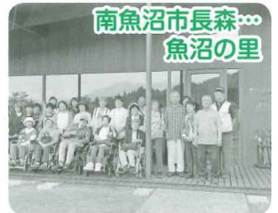
南魚沼市長森… 魚沼の里

今回は「みんなの社員食堂」でいただいた定食が本当においしくて、箸が止まりませんでしたよ!