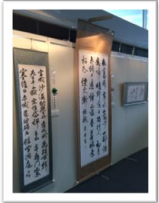
県美術展で三賞（県知事賞、実行委員長賞、審査員特別賞）を独占した書道作品も展示