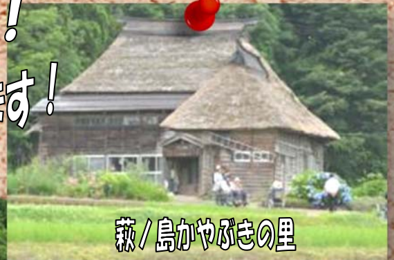
燕/島かやぶきの里