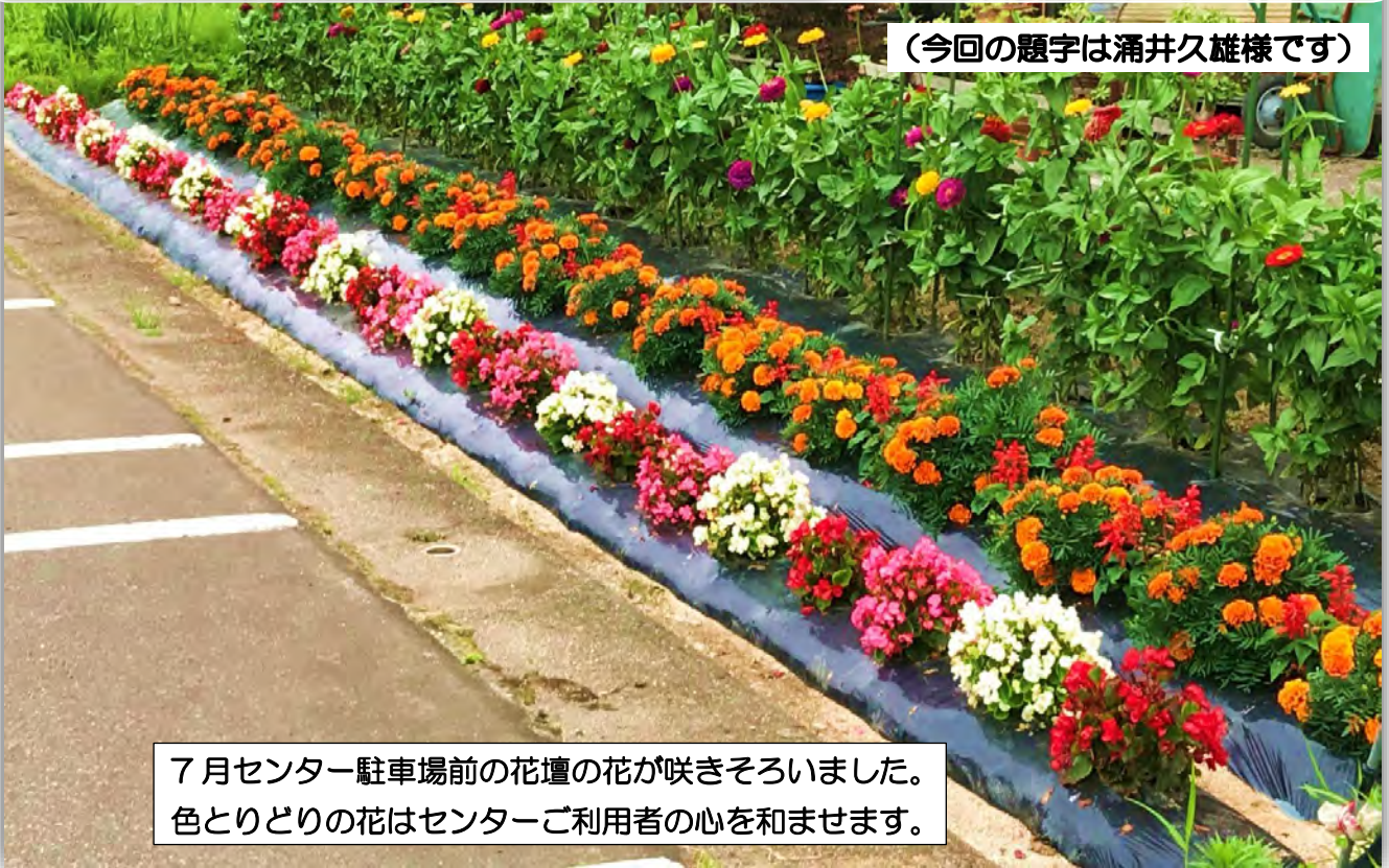
7月センター駐車場前の花壇の花が咲きそろいました。 色とりどりの花はセンターご利用者の心を和ませます。