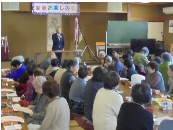
〈2月 新年のつどい 新春お楽しみ会〉

つどい活動は、新年のつどい、健康のつどいなど年4回のつどいを、平成園で開催しています。