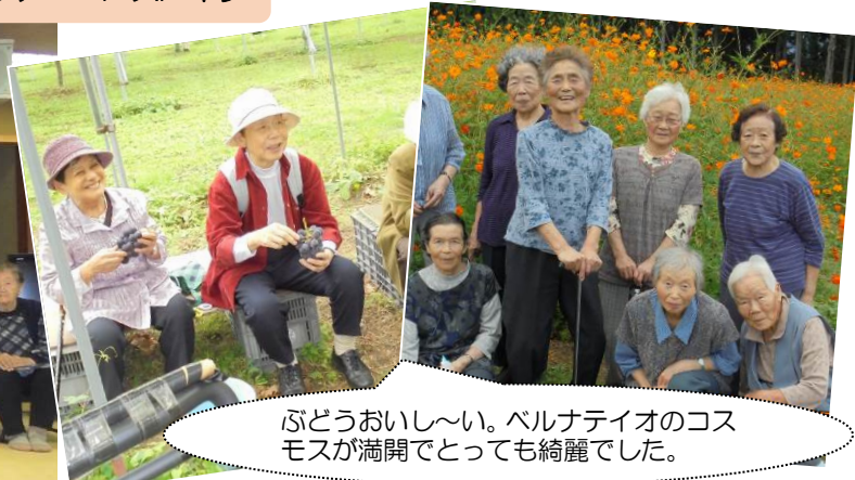
ふどうおいし〜い。ベルナティオのコスモスが満開でとっても綺麗でした。

つどいは、年に数回ご希望の利用者様全員が集まって、カラオケやゲームなどで楽しみます。バスツアーやバスハイクは季節にあわせてお花見や、さくらんぼ狩り、もみじ狩りなどがあります。午後からお出かけの買い物ツアーも楽しみにされています。