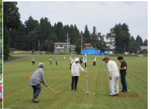
〈グラウンドゴルフ吉田クロスカントリー〉