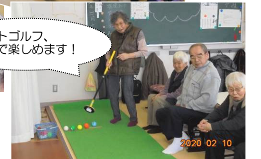
マットゴルフ、室内で楽しめます！

10月の運動会では、体力チェックから始めて、恒例のパン食い競争や玉入れなど張り切りしました。