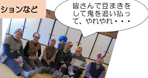
皆さんで豆まきをして鬼を追い払って、やれやれ・・・