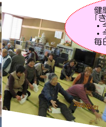
〈10月認知症予防教室開催〉

健康長寿の秘訣は「きょういく」と「きょうよう」。 ・今日、行くところがある。 ・今日、する用事がある。 毎日を楽しく過ごしましょう。