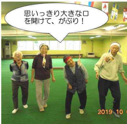
思いっきり大きな口を開けて、がぶり！

つどいは、年に数回ご希望の利用者様全員が集まって、カラオケやゲームなどで楽しみます。バスツアーやバスハイクは季節にあわせてお花見や、さくらんぼ狩り、もみじ狩りなどがあります。午後からお出かけの買い物ツアーも楽しみにされています。