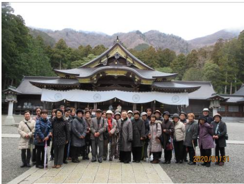
〈ふるさと体験 弥彦初詣〉

さあくる活動は、ふるさと体験、ポールウォーキング、グラウンドゴルフ、ボウリング、料理カラオケ、卓球、けんこつ体操、ゲートボールがあります。新たに健康麻将も始めました。