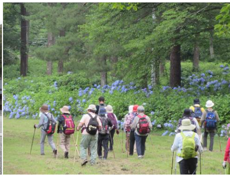
〈長野県の飯綱東公園でのポールウォーキング〉