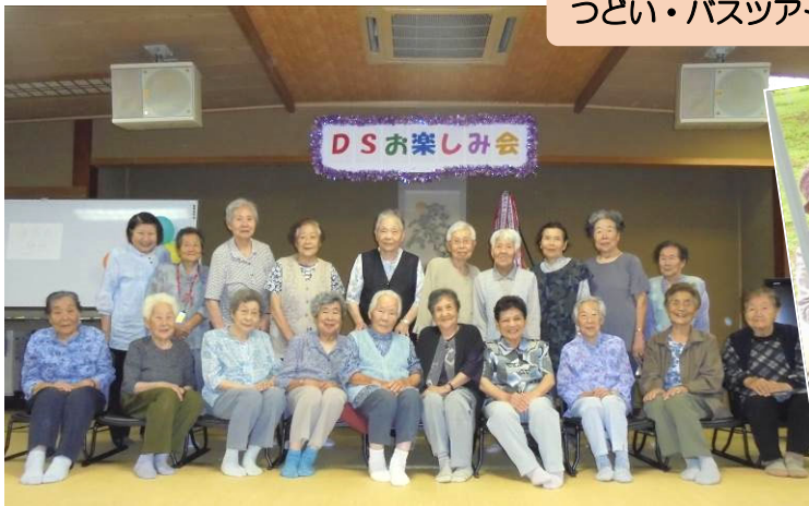
つどい・バスツアー・バスハイク

年に何回か創作活動をしています。左の写真は十五夜の餅つきのタペストリーです。和紙をちぎって貼り付けて、うさぎやお月様を作りました。ご利用者様全員参加の大きな作品に仕上がりました。他にも、年末には翌年のカレンダー作り、2月はちんころづくりもしました。楽しみながら、知恵を絞って、一人一人が味のある作品に仕上がっています。ご自宅に持ち帰った作品は、ご家族にお見せしていることでしょう。