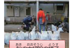
あき おおそうじ ようす 秋の大掃除の様子