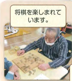
将棋を楽しんでいます。

おり紙を折って、はさみで切つてのりで貼って、みなさんで力をあわせて完成をめざします♪