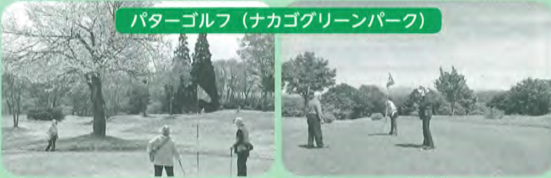
パターゴルフ (ナカゴグリーンパーク)