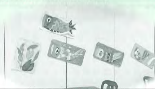
手描きの鯉のぼりも食堂で泳いでいます。