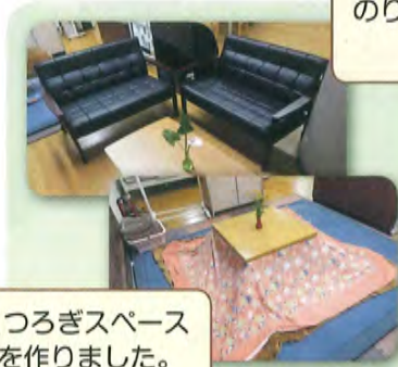
くつろぎスペースを作りました。