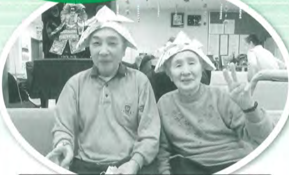
兜の前でピースサイン!!

5月、子どもの頃を思い出し、新聞紙で兜を折りました。室内で出来ることを工夫して、楽しんでいます。