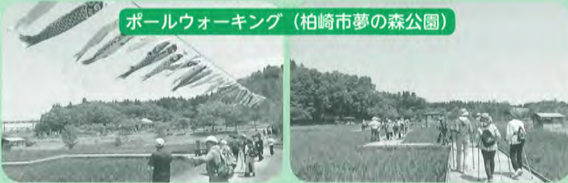
ポールウォーキング (柏崎市夢の森公園)