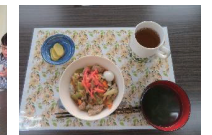
5月は中華丼でした