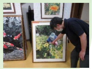
キルト展 in 段十ろう