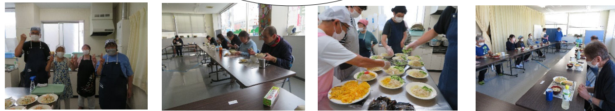
調理、準備片付けをみんなでします。毎回、好評です。