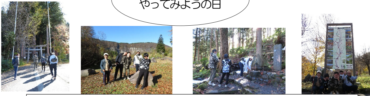
秋山郷へ紅葉を見に行きました。天気も良く、とても楽しいお出かけとなりました。